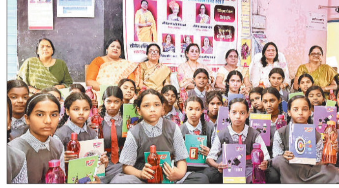
छात्राओं को कौपी, पेन एवं पानी बॉटल देती लीनेस क्लब की पदाधिकारी।

ऑल इंडिया लीनेस क्लब्स डिस्ट्रिक्ट सीजी-1, स्वर्णिम छत्तीसगढ़ द्वारा संचालित लीनेस क्लब जांजगीर-जाज्वल्या द्वारा कचहरी चौक जांजगीर के समीप स्थित शासकीय पूर्व माध्यमिक कन्या शाला में संस्कार शिक्षा प्रदान करने