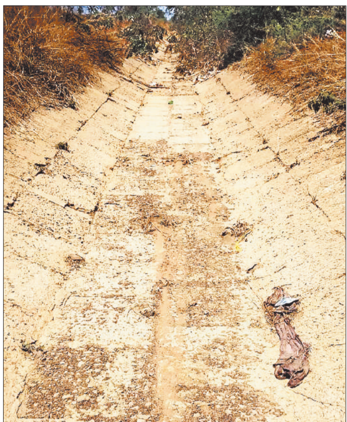
सूखा पड़ा नहर।

क्षेत्र के टेल एरिया में जल संकट लगातार गंभीर होता जा रहा है। एक ओर शासन द्वारा 'गांव चलो अभियान' के तहत योजनाओं का प्रचार-प्रसार किया जा रहा है, वहीं दूसरी ओर गोधना, कुकदा, कुरियारी और सलखन जैसे गांवों में बुनियादी जरूरत पानी के लिए लोग तरस रहे हैं। तालाबों में निस्तारी हेतु पानी उपलब्ध नहीं होने से ग्रामीणों को भारी परेशानियों का सामना करना पड़ रहा है। आदर्श ग्राम गोधना का नया तालाब सहित आसपास के तालाब सूखने की कगार पर पहुंच गए हैं। नहर में पानी छोड़े जाने के बावजूद टेल एरिया तक पानी नहीं पहुंच पा रहा है, जिससे तालाब भरने का कार्य पूरी तरह प्रभावित है। हालात यह हैं कि ग्रामीण गंदगी युक्त पानी में ही स्नान और दैनिक कार्य करने को मजबूर हैं। ग्रामीणों का आरोप है कि सिंचाई विभाग द्वारा जल वितरण में असंतुलन बरता जा रहा है। धुरकोट नहर डिवाइडिंग सेक्टर से नवागढ़ क्षेत्र में 350 क्यूसेक से अधिक पानी छोड़ा जा रहा है, जबकि मुडपार क्षेत्र में 250 क्यूसेक से भी कम पानी पहुंच रहा है। इसका सीधा असर टेल एरिया के गांवों पर पड़ रहा है। इसके अलावा सेमरा और